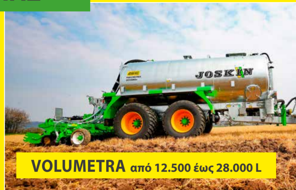
VOLUMETRA από 12.500 έως 28.000 L