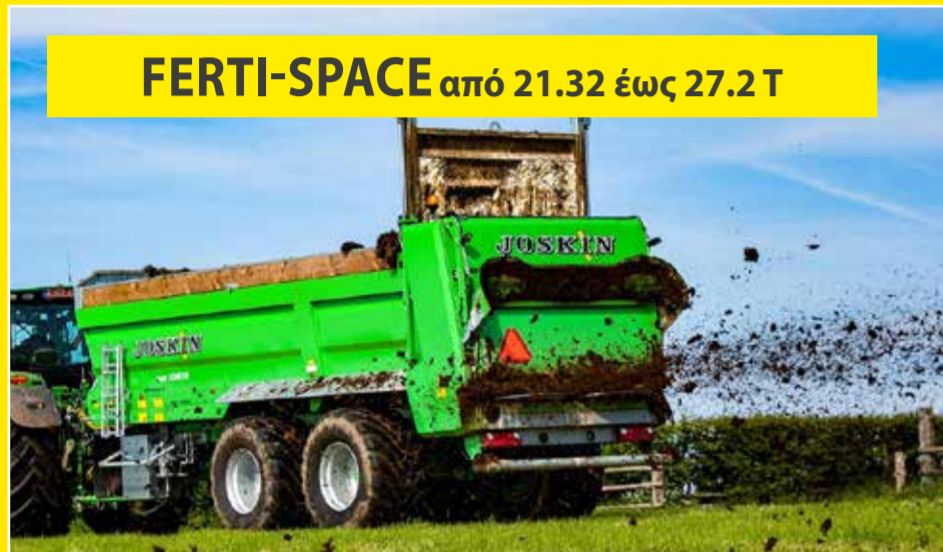
FERTI-SPACE από 21.32 έως 27.2 T