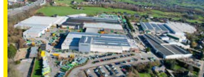
Μονάδα παραγωγής της JOSKIN στο Βέλγιο (65.000 m 2 )

Χρησιμοποιούμε τις πιο σύγχρονες τεχνικές, μερικές από τις οποίες είναι μοναδικές στην Ευρώπη: τρισδιάστατη δυναμική προσομοίωση, αυτοματοποιημένα λέιζερ, πιστήρια διπλώσεως, χάλυβας υψηλής αντοχής, γαλβανισμός εν θερμώ κ.ά.