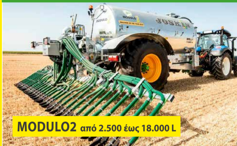
MODULO2 από 2.500 έως 18.000 L