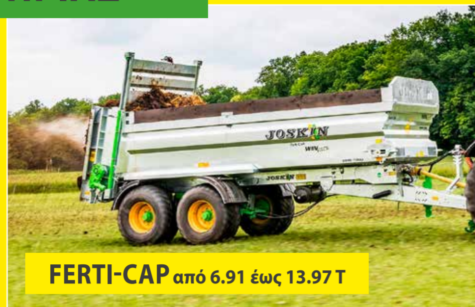
FERTI-CAP από 6.91 έως 13.97 T