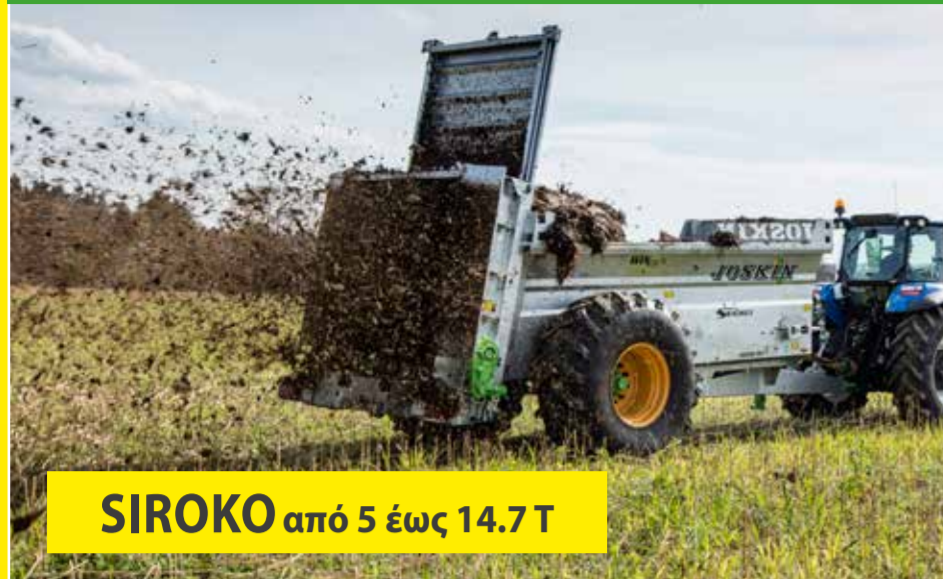
SIROKO από 5 έως 14.7 T