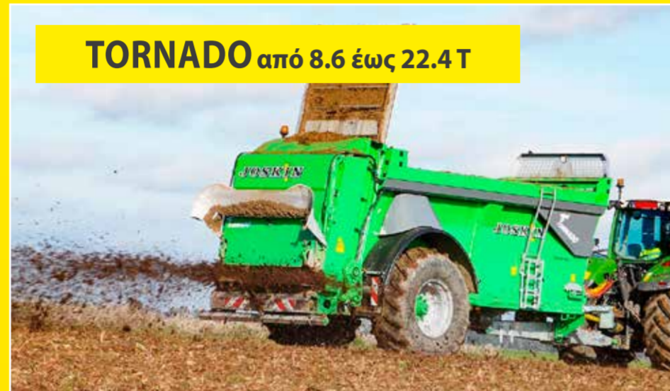
TORNADO από 8.6 έως 22.4 T