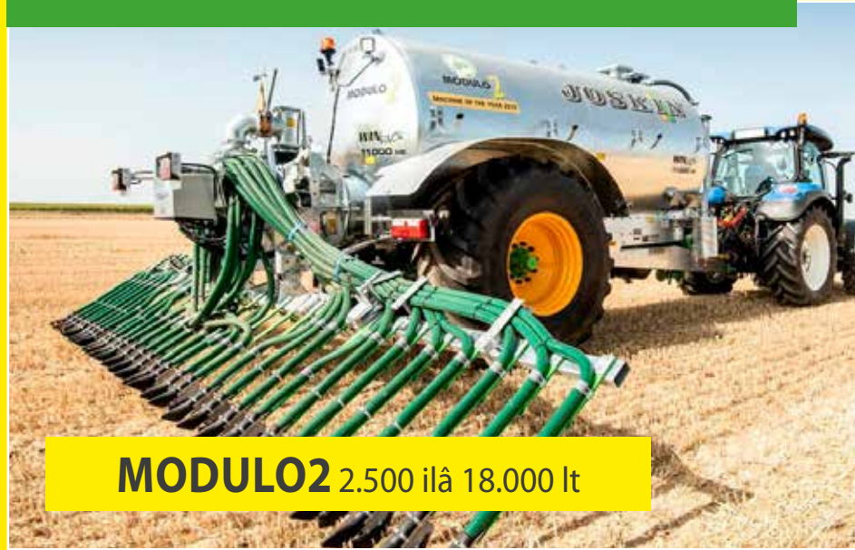
MODULO2 2.500 ilâ 18.000 lt