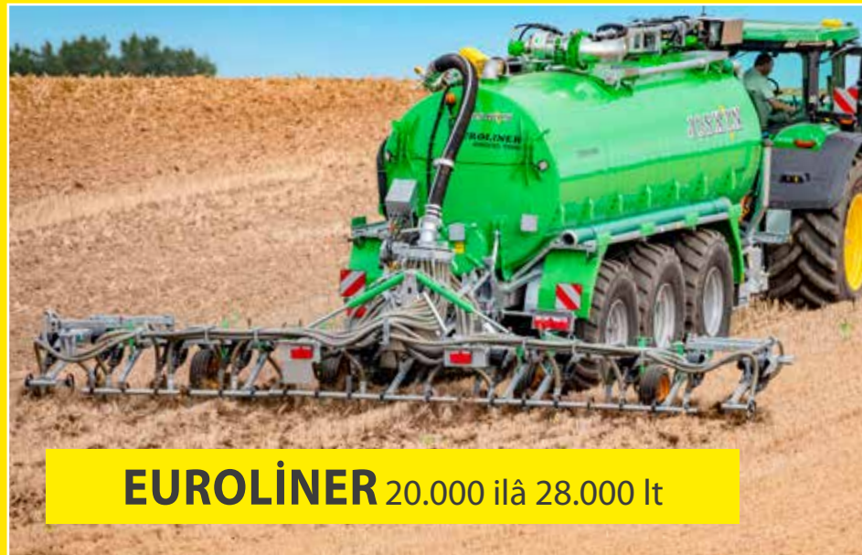
EUROLİNER 20.000 ilâ 28.000 lt

JOSKIN sulu gübre serpme makineleri yelpazesi 75 model içermektedir. İhtiyaçlarınızı karşılayacak 700 seçeneğimiz var. JOSKIN özel çelik tiplerini tercih etmekte ve bunlarla çalışmaktadır. İhtiyaçlarınıza mükemmel uyum sağlamak için tüm sulu gübre tankerlerine farklı arka ataşmanlar takılabilir