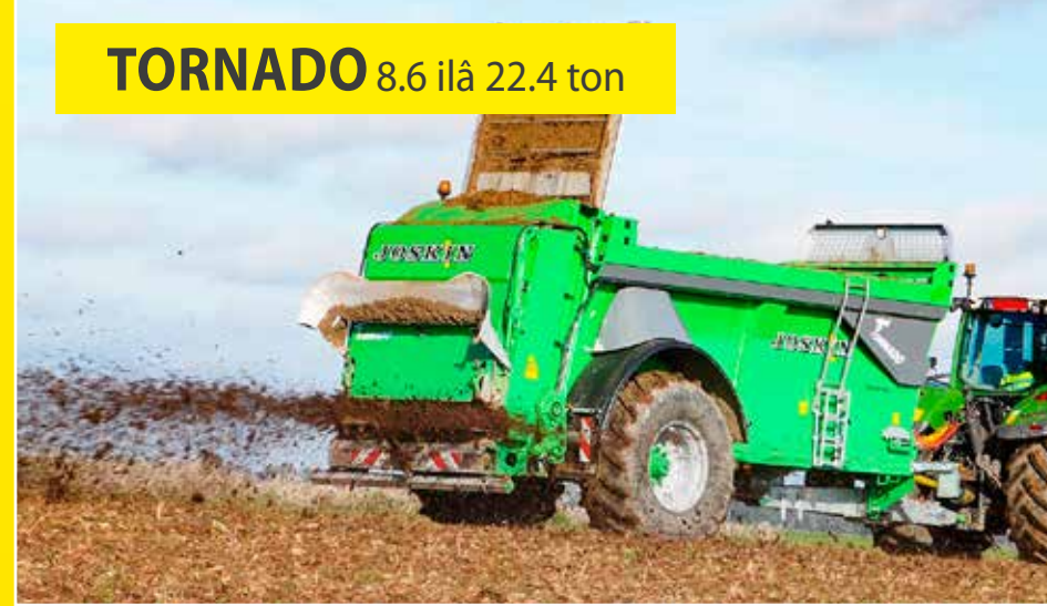
TORNADO 8.6 ilâ 22.4 ton