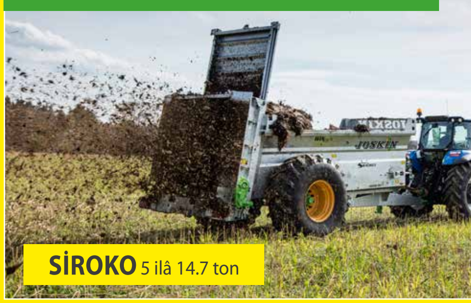
SIROKO 5 ilâ 14.7 ton