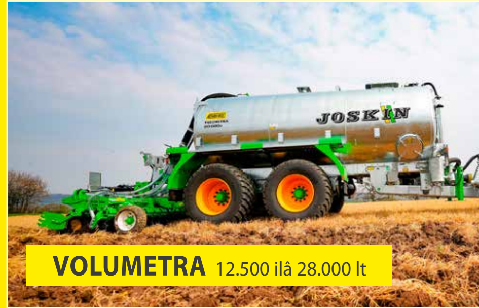
VOLUMETRA 12.500 ilâ 28.000 lt