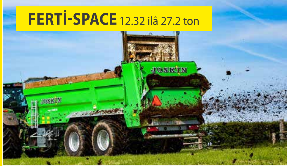
FERTI-SPACE 12.32 ilâ 27.2 ton