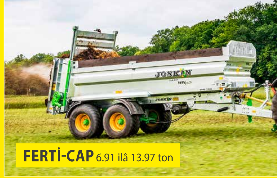
FERTI-CAP 6.91 ilâ 13.97 ton