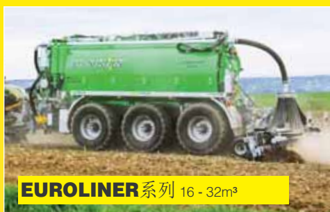
EUROLINER 系列 16 - 32m³

JOSKIN 公司的液体施肥罐车共有75个大类，超过700种型号。可以满足客户的各种需求。