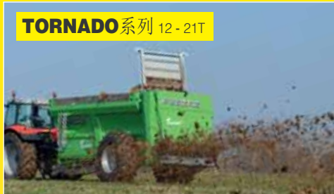
TORNADO 系列 12-21T