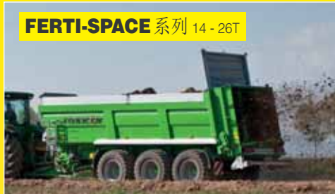
FERTI-SPACE 系列 14-26T