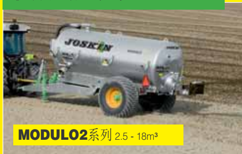
MODULO2 系列 2.5 - 18m³