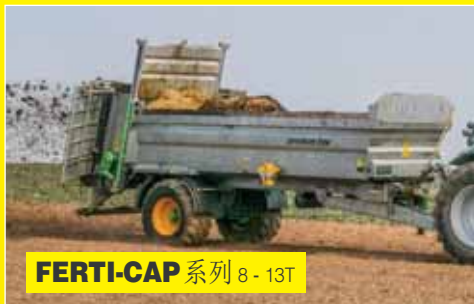
FERTI-CAP 系列 8-13T