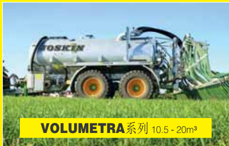
VOLUMETRA 系列 10.5 - 20m³