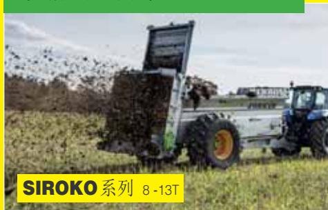
SIROKO 系列 8-13T