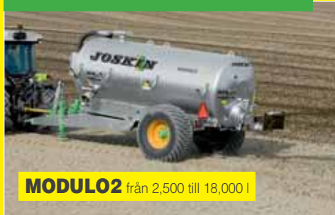
MODULO2 från 2,500 till 18,000 l