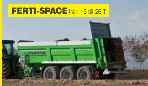
FERTI-SPACE från 15 till 26 T