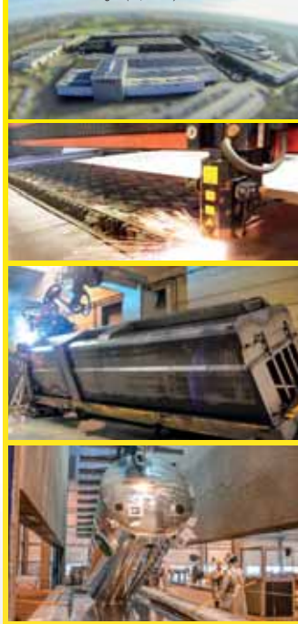
JOSKINS fabrik i Belgien (65,000 m 2 )

Vid tillverkningen använder vi de modernaste av tekniker, några av dem unika i Europa: 3D dynamisk simulation, automatiserade lasrar, vikningspressar, delar i höghållstål, varmförzinkning, etc.