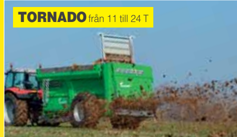
TORNADO från 11 till 24 T