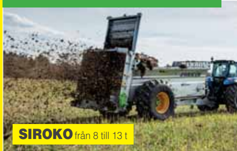
SIROKO från 8 till 13 t