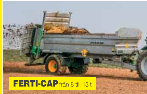
FERTI-CAP från 8 till 13 t