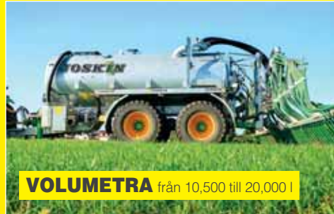
VOLUMETRA från 10,500 till 20,000 l